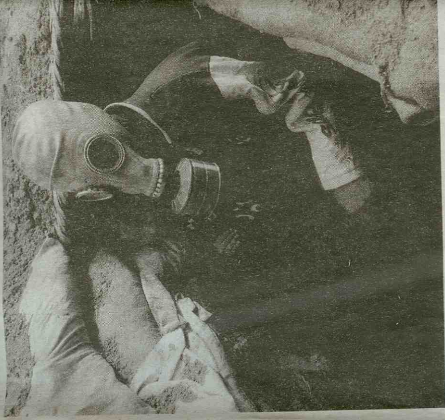
يوقع المصور الصحفي الفرنسي - اللبناني باتريك باز غدا كتابه «لا تلتقط صورتي» العراقيون لا يكون، خلال معرض الكتاب الفريكتوني في بيروت. ويعمل باز في «وكالة الصحافة الفرنسية» منذ أكثر من ٣٠ سنة. يحاول الكتاب بالصورة، تجسيد ما عاشه الـ لعراقي بين عامي ٢٠٠٣ و٢٠٠٨، مع تعليقات بخط اليد باللغة الفرنسية، مترجمة إلى الإنكليزية. والمصور تفر عن اللحظات المسروقة من جنون الحرب والرعب والمفج المستمر، في حياة العراقيين اليومية. نال الكتاب، خلال اطلاقه، التمهيد في مهرجان «بايو» الدولي (فر الجمهور والصحافة. (المصور من الكتاب).

غير أن الوصية تشير إلى أنها وقعت في لوس أنجلوس ما يعني أن توقيع مايكل مزور.