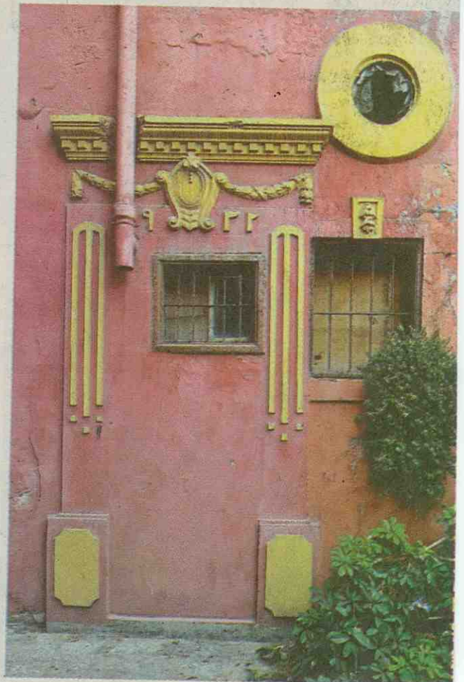
Façade colorée à Aïn el-Mreissé.