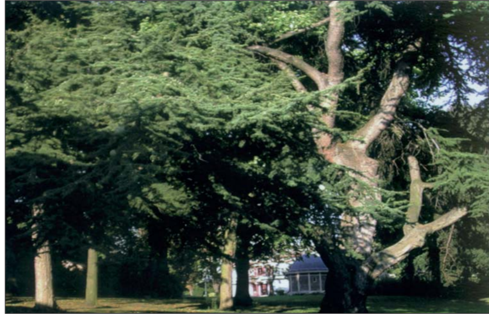
● ظلال الأرز في باريس

العاصمة الفرنسية، تاكسيات العاصمة وسيارات الاجرة وكل وسائل الخدمة العامة والشخصية، والمواقع الإلكترونية حول لبنان.