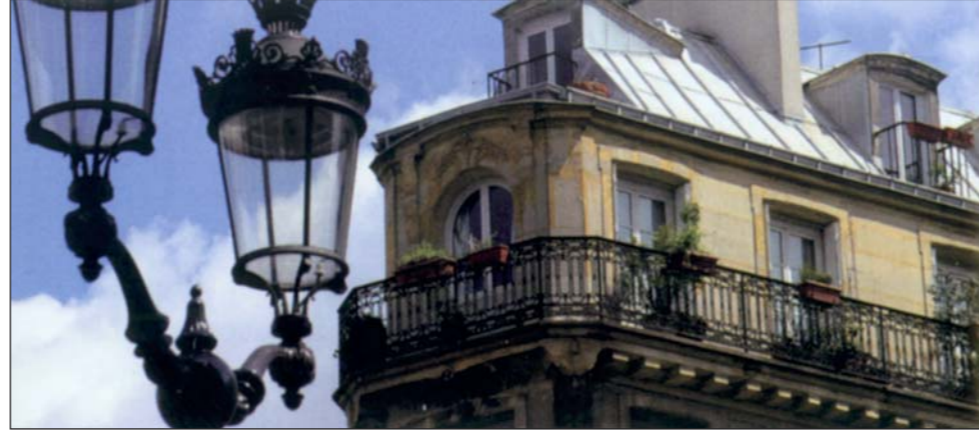
● شرفة لبنانية في باريس