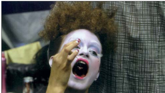
● فنانون في باريس