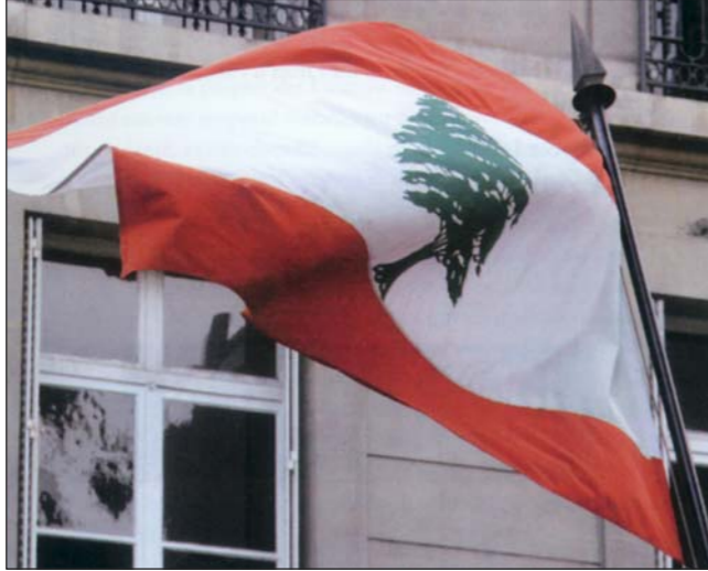
● العلم اللبناني فوق السفارة اللبنانية في العاصمة الفرنسية