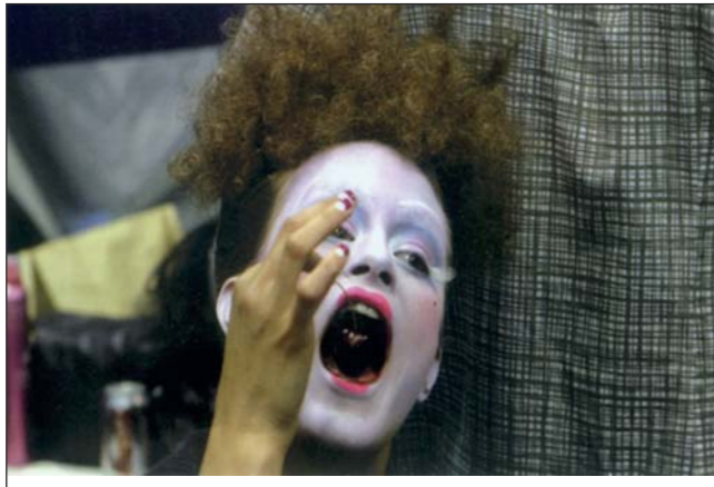
● الرقص الشرقي