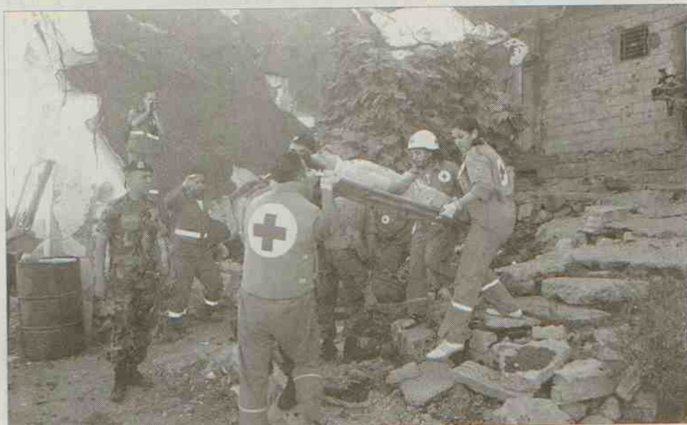
Sauver des vies en toutes circonstances, notamment en temps de guerre.

« Je viens de redécouvrir ces principes. Je les connaissais pourtant par cœur ! Tout ce qui était resté dans ma mémoire avant que je ne replonge dans cette période de ma vie ! Tout au plus, les grandes lignes. Je ne m'en rappelais même plus ! Je m'étais pourtant juré de les suivre en tout temps, j'en avais fait serment ! Ce n'est peut-être qu'aujourd'hui que je réalise combien je les ai vécus, combien pendant toute cette période et, par la suite dans ma vie "civile", je les ai réellement suivis sans vraiment réaliser ce qu'ils représentent. » Ces principes sont ceux de la Croix-Rouge. L'auteur de ces lignes