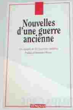
Nouvelles d'une guerre ancienne, 2005

Cette jeune journaliste a observé les hommes autour d'elle et en a dépeint "20 portraits d'hommes à consommer sans modération." Autour de descriptions croustillantes, s'égrènent des réflexions sur l'homme moderne agrémentées de quelques citations et des illustrations comiques et spirituelles de Benoit Debbané. Portraits et archétypes des Libanais dans lesquels toute femme pourrait y reconnaître son conjoint, père, frère.